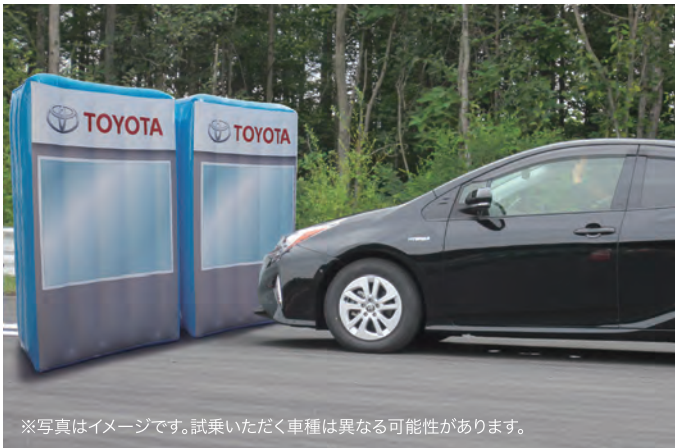
※写真はイメージです。試乗いただく車種は異なる可能性があります。

万一の時にサポートしてくれる「踏み間違い時サポートブレーキ」をご体感いただけます