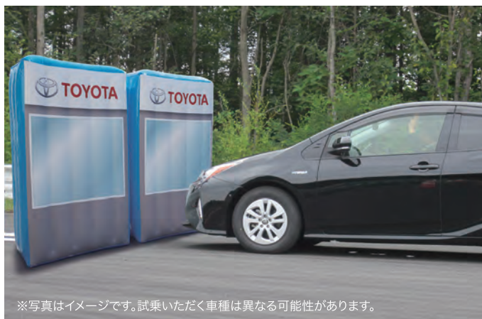
※写真はイメージです。試乗いただく車種は異なる可能性があります。

万一の時にサポートしてくれる「踏み間違い時サポートブレーキ」をご体感いただけます